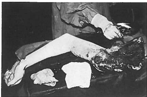
Abb. 1. Ausgerissene li. obere Extremität samt Schulterblatt (bedeckt mit ms. subscapularis). Nekrotische Haut am Oberarm bereits exziiert.